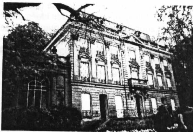
Vermont en 1999.